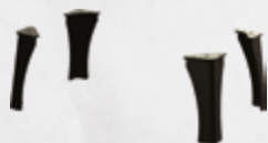
Hoge poten / Pieds hauts