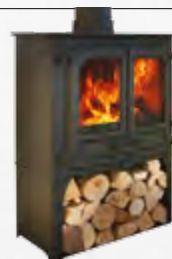
ISLAND 2 + sokkel / socle