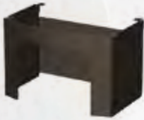
Sokkel COVE / Socle COVE