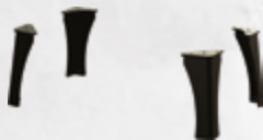
Hoge poten ISLAND Pieds hauts ISLAND