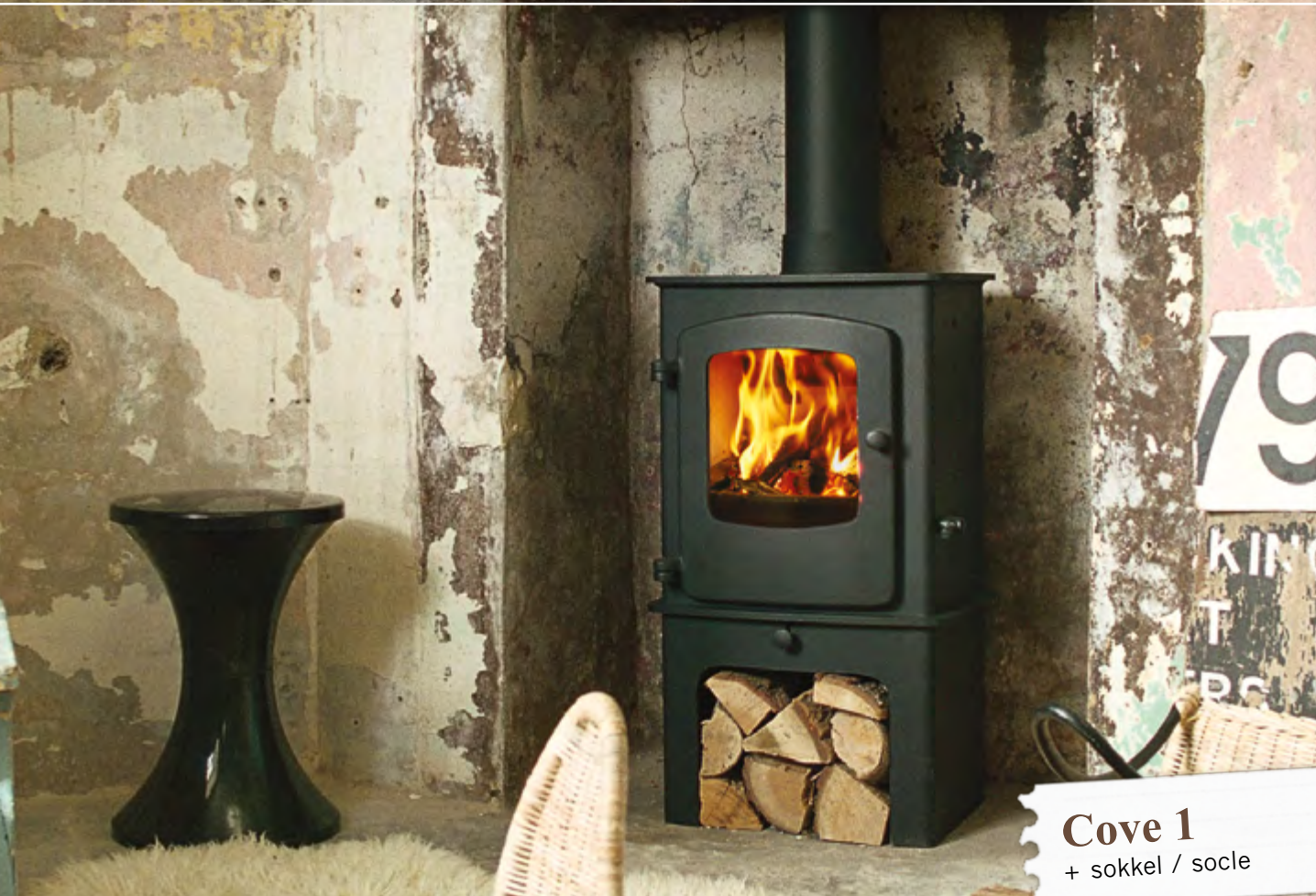
Cove 1 + sokkel / socle

Hoewel de Cove gesofisticeerd is qua design, is hij bijzonder eenvoudig te bedienen. Met één verwijderbare handgreep kan u zowel de deur openen als het schudrooster bedienen. De Cove is beschikbaar in 3 formaten en met een optionele sokkel.