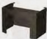
Sokkel / Socle