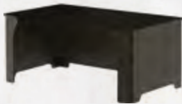
Sokkel ISLAND / Socle ISLAND