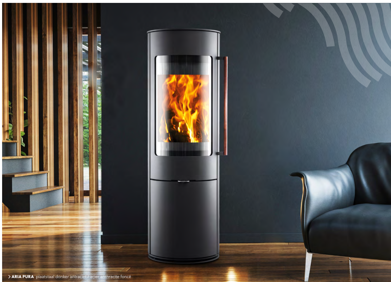
> ARIA PURA plaatstaal donker antraciet / acier anthracite foncé