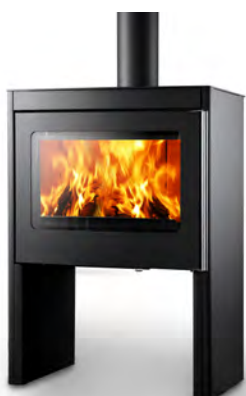
> VARO plaatstaal donker antraciet acier anthracite foncé

Le VARO est un modèle performant qui allie style et fonctionnalité. La niche en bois ouverte dans la partie inférieure offre un espace de rangement pratique pour les bûches. Profitez d'une large chambre de combustion qui garantit une vue panoramique et magistrale des flammes. Grâce au raccordement à l'air extérieur, une combustion efficace est garantie, ce qui fait du VARO un excellent choix pour les grandes pièces. Le Varo est équipé d'une élégante poignée en acier inoxydable et est disponible en version acier ou stéatite.