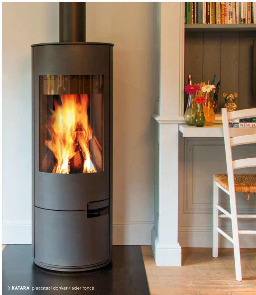
> KATARA plaatstaal donker / acier foncé