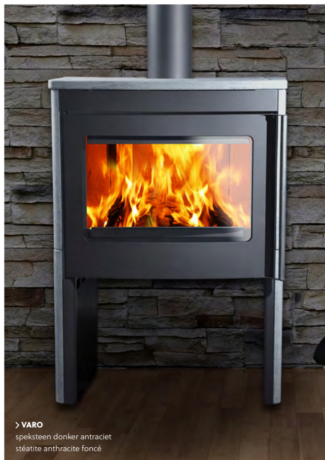
> VARO speksteen donker antraciet stéatite anthracite foncé

De VARO is een performant model dat stijl met functionaliteit combineert. De open houtnis onderaan is een praktische opslag voor de houtblokken. Geniet van een brede branderkamer die die een panoramisch en magistraal zicht op de vlammen garandeert. Dankzij de externe luchtaansluiting is een efficiënte verbranding gegarandeerd, waardoor de VARO een uitstekende keuze is voor grotere ruimtes. De Varo is uitgerust met een elegante, inox handgreep en verkrijgbaar in een stalen of spekstenen uitvoering.