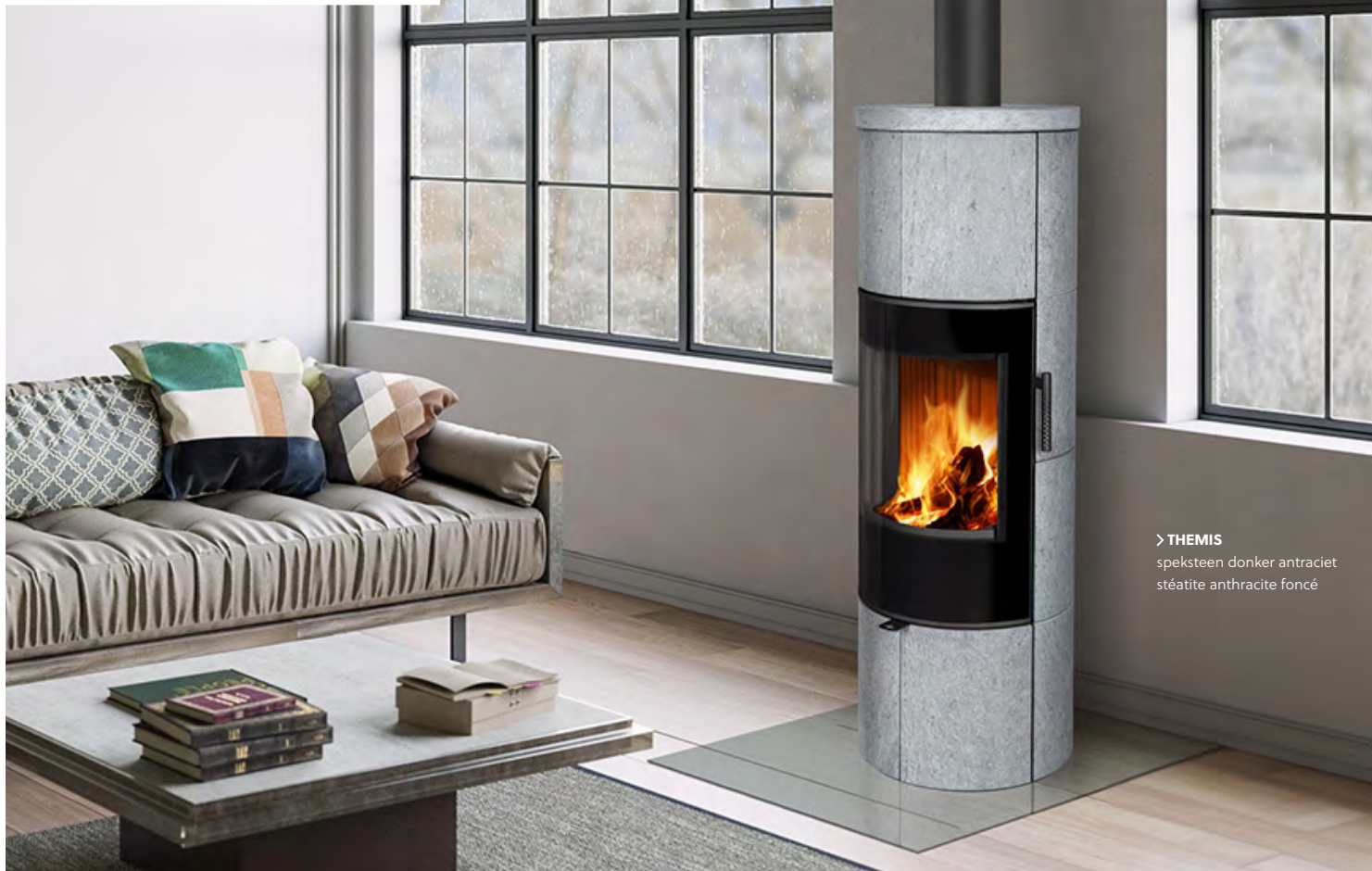
> THEMIS speksteen donker antraciet stéatite anthracite foncé