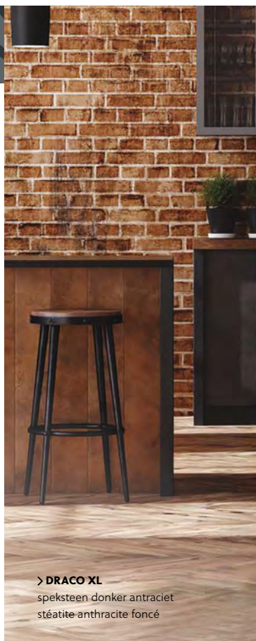
> DRACO XL speksteen donker antraciet stéatite anthracite foncé