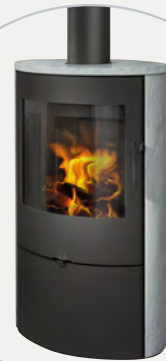
> ELEGANT PLUS speksteen / stéatite

H x B x D / H x L x P: 974/996 x 516 x 397 mm