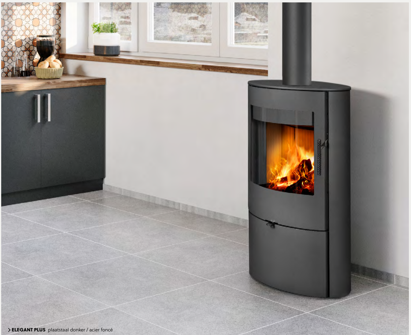
> ELEGANT PLUS plaatstaal donker / acier foncé